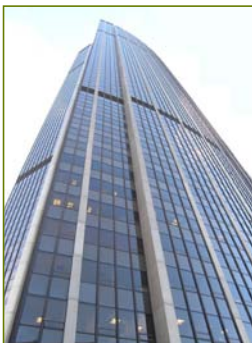
Strucurae