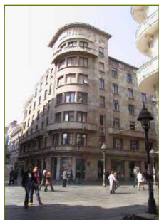
Façade du Centre culturel français Belgrade (Serbie)