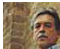
Paulo Mendes da Rocha