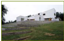
La Maison Carré, cerca de París, diseñado por A. Aalto y propiedad de la Fundación Filandesa para la Cultura