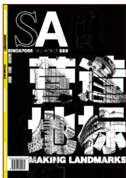
SA Instituto de Arquitectos de la Revista Singapur