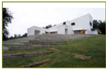
La Maison Carré, cerca de París, diseñado por A. Aalto y propiedad de la Fundación Filandesa para la Cultura