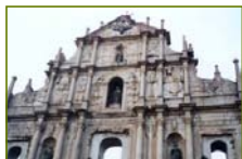
Catedral de Macao