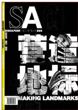
SA Instituto de Arquitectos de la Revista Singapur