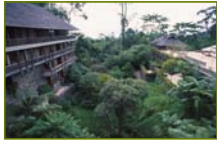
Dataran Mahkota, Pulau Langkawi, Malasia, Kerry Hill Architects, Premio Aga Khan de arquitectura 2001