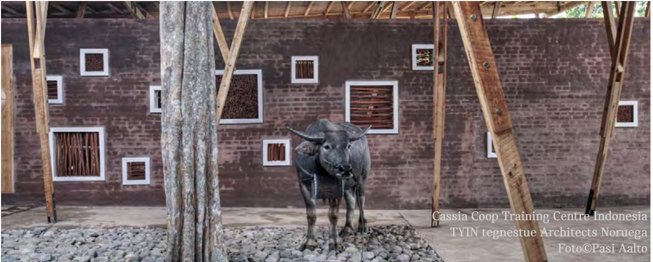
Cassia Coop Training Centre Indonesia TYIN tegnestue Architects Noruega