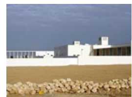
Estudio TAMASSOCIATI, Centro de urgencias pediátricas de Puerto Sudán Premio Giancarlo Ius 2013