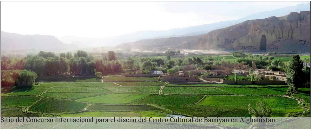
Sitio del Concurso internacional para el diseño del Centro Cultural de Bamiyán en Afganistán