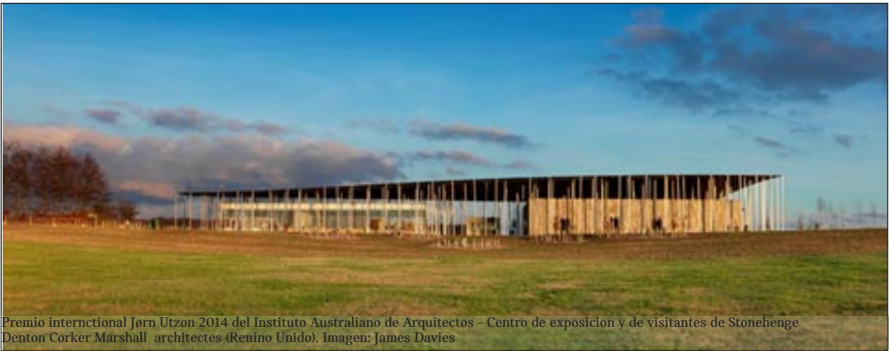
Premio internacional Jørn Utzon 2014 del Instituto Australiano de Arquitectos – Centro de exposición y de visitantes de Stonehenge Denton Corker Marshall architects (Reino Unido).