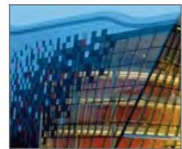
Centro de Congreso de Cracovia.