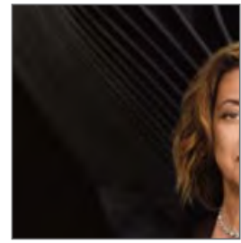
Zaha Hadid