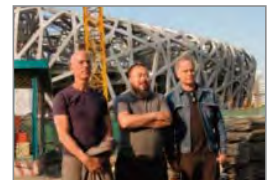
Jacques Herzog y Pierre de Meuron junto con Ai Weiwei delante del Nido de Pájaro en Pekín