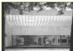
Nordic Pavilion in Giardini, Venice. Architect Sverre Fehn, 1962.