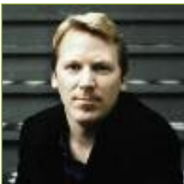
Cameron Sinclair co-fundador de 'Architecture for humanity'