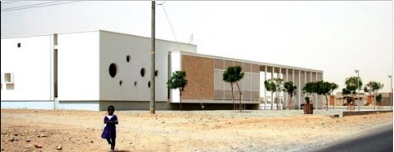
Centro pediátrico de Port Sudan, Studio Tamassociati Architects, ganadores de "Arquitecto Italiano 2014"