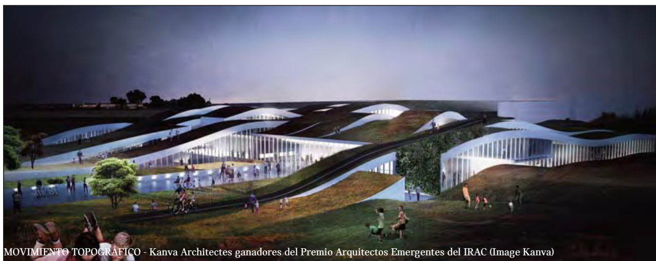
MOVIMIENTO TOPOGRÁFICO - Kanva Architects ganadores del Premio Arquitectos Emergentes del IRAC (Image Kanva)