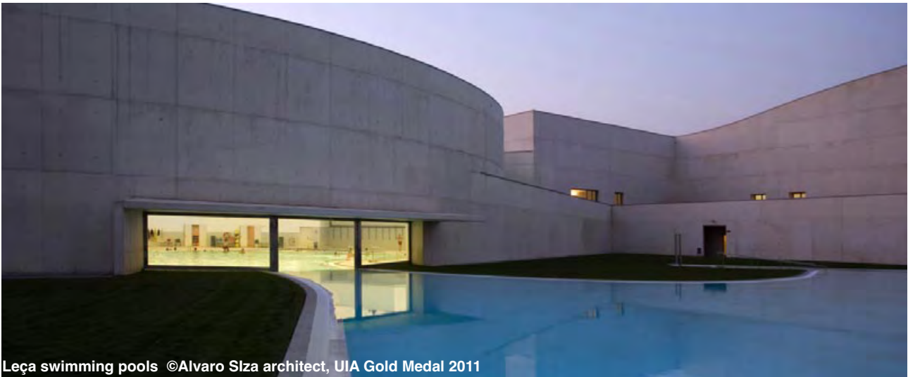
Leça swimming pools ©Alvaro Siza architect, UIA Gold Medal 2011