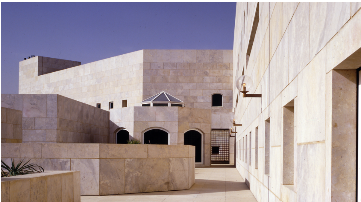
Ministère des Affaires Étrangères, Riyadh, Arabie Saoudite, architecte Henning Larson (1984)

Les questions peuvent être adressées aux organisateurs du prix .