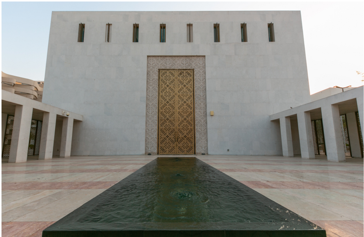
Mosquée Juma à Doha, Qatar, John McAslan and Partners, lauréat du Prix Abdullatif Al Fozan 2017